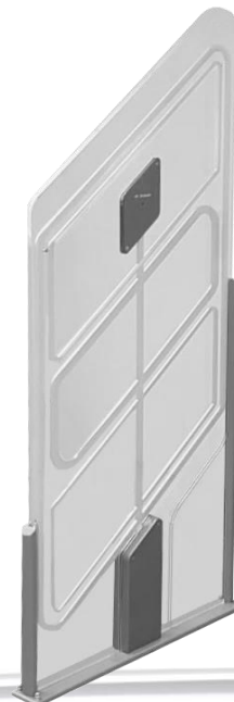
Quartz RFID & EM

Die für die Sicherung notwendigen RFID-Etiketten und Magnetstreifen sind bei avacom in diversen Ausführungen erhältlich.