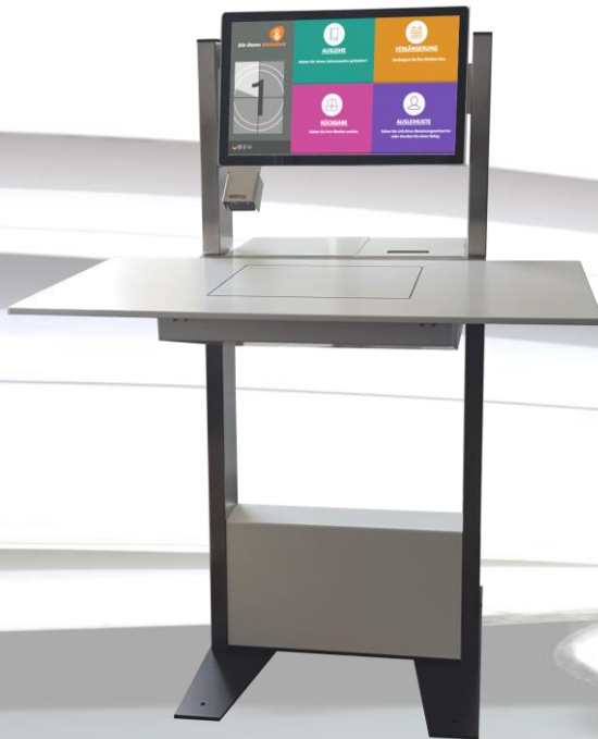
H-Type freistehendes Modell

avacom bietet eine Vielfalt von innovativen Selbstverbuchungssystemen in verschiedenen Technologien an. Dank der einfachen und benutzerfreundlichen Bedienung werden die Bibliotheksmitarbeiter spürbar von Routinearbeiten entlastet und haben mehr Zeit, sich den Bedürfnissen der Besucher anzunehmen. Für diese wiederum entfällt ein zeitraubendes Anstehen an der Theke.