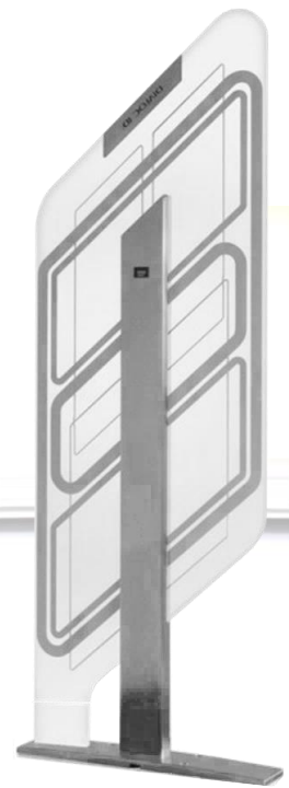
Diamond RFID, EM & Hybrid